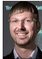
Dirk Helbing (ETH Zürich)

Die Technologien sind auf dem Weg zur Konvergenz. Im Zeitalter des allgegenwärtigen Com-