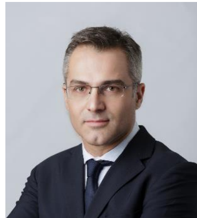
Antonios Siarkos, Präsident der European Cotton Alliance

Last but not least wird die ‘EU- Cotton’-Initiative der European Cotton Alliance, der Vereinigung europäischer Baumwollorganisationen, vorgestellt. Sie ermöglicht europäischen Baumwollfarmern und ihnen angeschlossenen Unternehmen, ihre Baumwolle mit einem EU-Baumwolllabel auszustatten, das auch in weiterverarbeiteten Baumwolltextilprodukten wiederzufinden ist. Das damit verbundene Lizenzierungsprogramm könnte durch Transparenz und Rückverfolgbarkeit eine marktnahe Textilproduktion in Europa lukrativer machen.