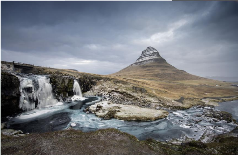
1_REHAU_Passion_for_color_2020_Island verzaubert mit atemberaubender Natur